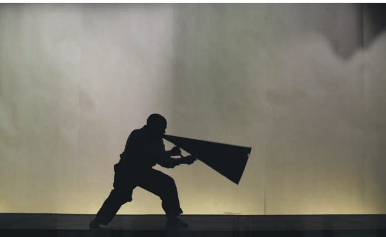
Still uit de film The refusal of time van William Kentridge.