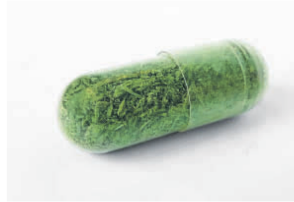
Martijn Engelbregt vraagt zich met Placebokunst af of kunst invloed heeft op de gezondheid.