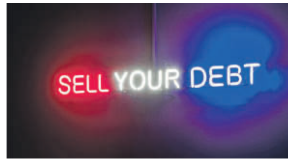
Het Parijse collectief Claire Fontaine stelt met de neoninstallatie Sell your debt het economische systeem waarin schuldhandelswaar is aan de kaak.

genstromen in Europa sinds de jaren tachtig. Het ziet er prachtig uit, maar het maakt je ook bewust dat die stromen steeds meer en meer worden. Op een ander scherm zie je de laatste technologie op het gebied van archeologie, waardoor je niet meer in de grond hoeft te graven. Er is een scan van een gebied in Bosnië. Het ziet er ‘wow’ uit, maar ondertussen stuit men op menselijke resten in de grond. Die tegenstelling van indrukwekkende technologieën en confronterende beelden komen regelmatig terug in Hacking Habitat .”